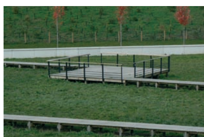
Cheminement garde-corps horizontaux