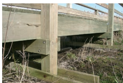
Cheminement avec des systèmes de patins stabilisateurs évitant l'utilisation du béton