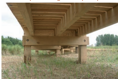
Azobé et planche et garde-corps en pin