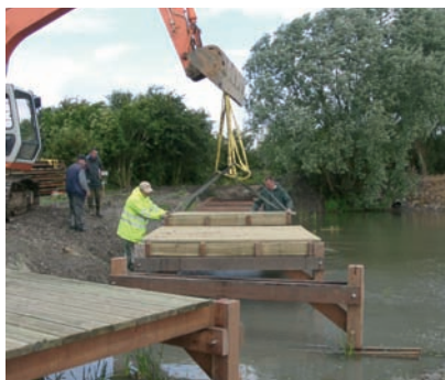
Platelage avec poteaux