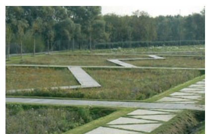
Cheminement sans garde-corps

Structure bois exotique / platelage et garde-corps en pin traité autoclave classe IV