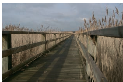
Platelage en pin traité autoclave classe IV

Marcanterra Bois et Plantes BP 90043 48, Chemin des Garennes 80120 St Quentin en Tourmont FRANCE Tél. +33 (0) 322 25 02 71 Fax + 33 (0) 322 25 08 79 www.marcanterra.fr boisplantes@marcanterra.fr