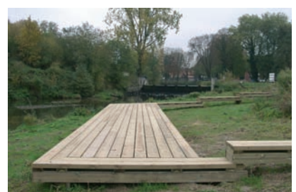
Cheminement avec zone d'accueil du public