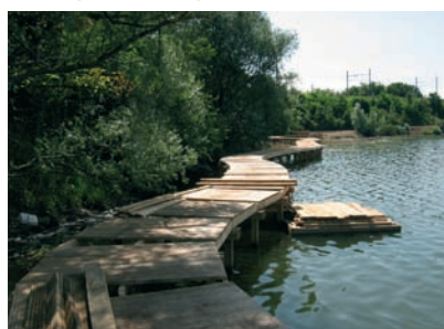
Cheminement en pied de berge - structure et platelage en chêne et garde-corps en châtaignier