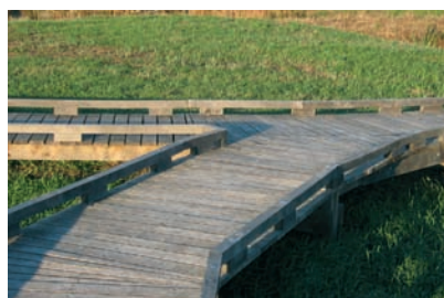
Cheminement avec chasse-roue - zone d'expansion crue - Structure en chêne et platelage brut non raboté en robinier faux acacia