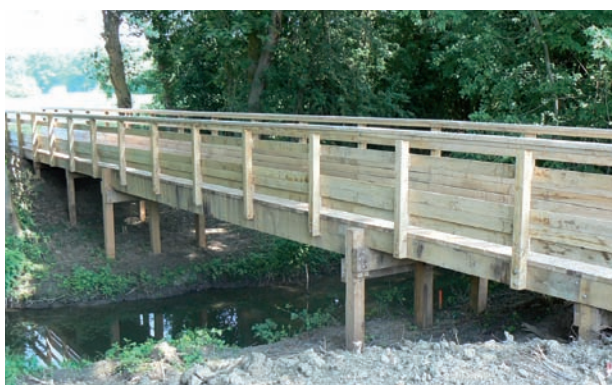
Passerelle droite sur portiques bois, poutres brutes / Platelage non raboté en robinier faux acacia Garde-corps normalisé en chêne, à balustres verticales