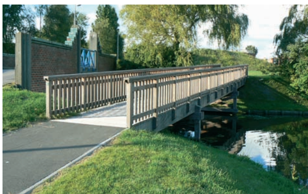
Passerelle sur portique - Structure, platelage et garde-corps en bois exotique

Marcanterra Bois et Plantes BP 90043 48, Chemin des Garennes 80120 St Quentin en Tourmont FRANCE Tél. +33 (0) 322 25 02 71 Fax + 33 (0) 322 25 08 79 www.marcanterra.fr boisplantes@marcanterra.fr