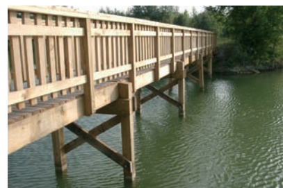
Poutres porteuses brutes en chêne avec plusieurs portiques intermédiaires en chêne