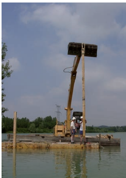
Battage des pieux à refus avec vérification de descente de charge